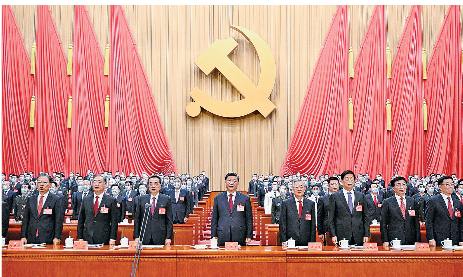
10月16日,中国共产党第二十次全国代表大会在北京人民大会堂开幕。这是习近平、李克强、栗战书、汪洋、王沪宁、赵乐际、韩正、胡锦涛在主席台上。

新华社北京10月16日电 凝心聚力擘画复兴新蓝图,团结奋进创造历史新伟业。举世瞩目的中国共产党第二十次全国代表大会16日上午在人民大会堂开幕。