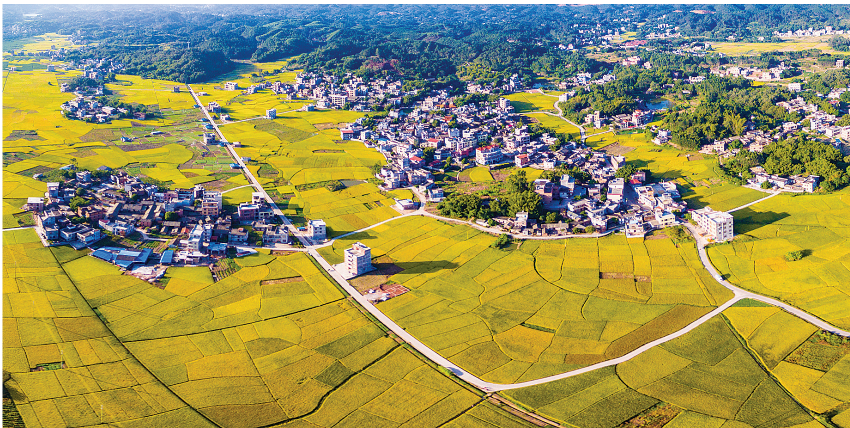
锦绣田园,丰收年景。