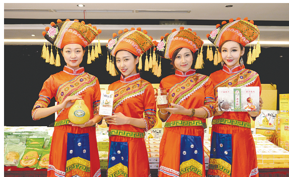
容县沙田柚产品享誉全国。