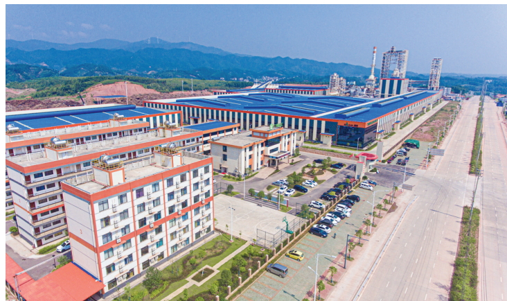
位于广西生态板材家具产业园的广西高林林业股份有限公司。