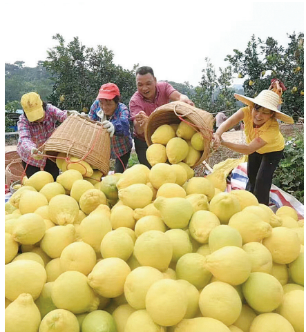
中国珍果——容县沙田柚丰收。