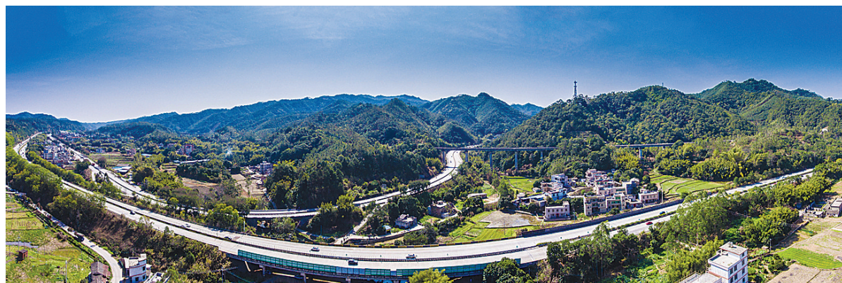
道路交通便捷。