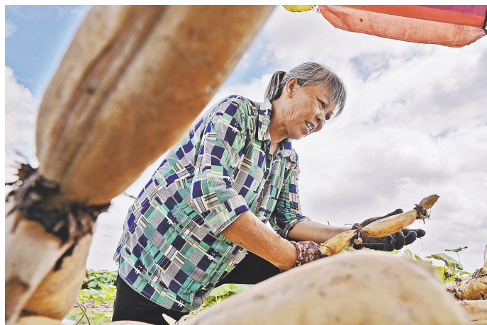
▲莲藕成为博白县三滩镇守育村村民的增收产业。