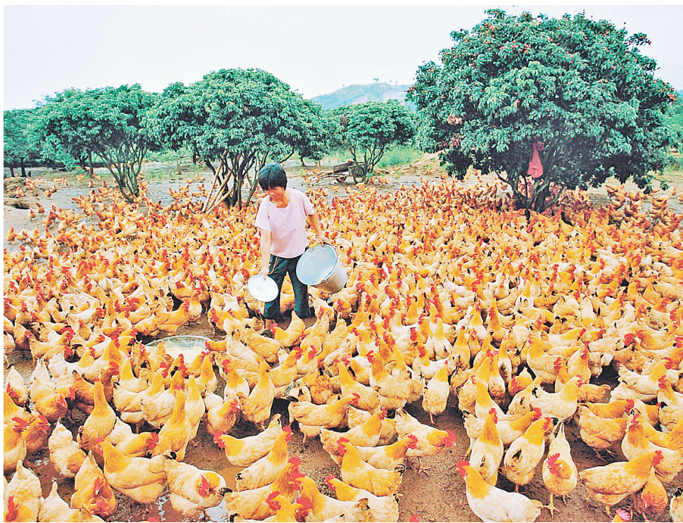
▲玉林是中国三黄鸡之乡,三黄鸡产业已发展成为农村的支柱产业。