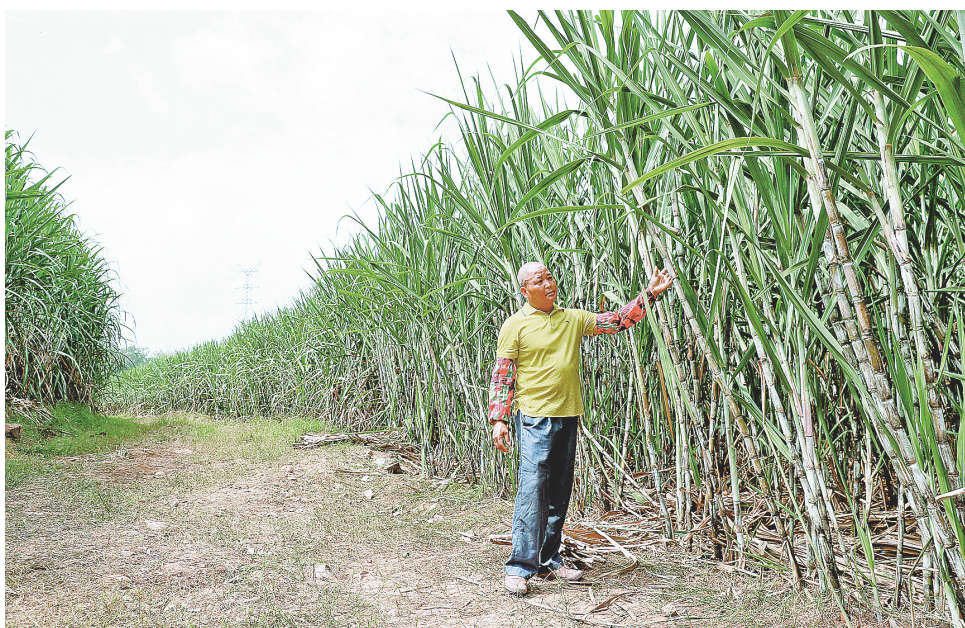
▲甘蔗是农民增收的一条渠道。