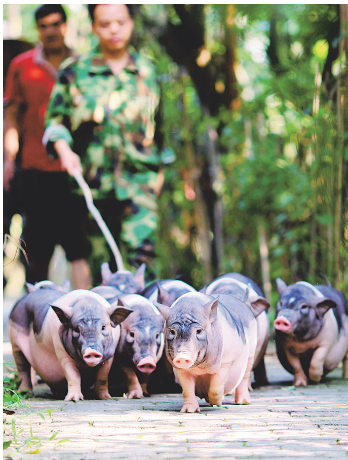
▲全国八大地方名猪——陆川猪。