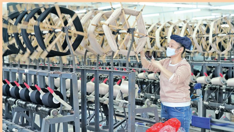
广西分之管漂染有限公司纺纱车间。