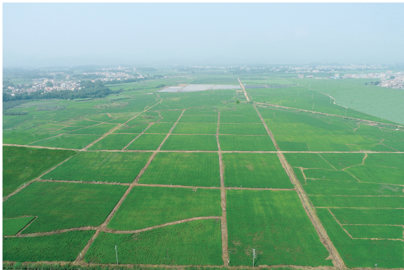
樟木镇富硒优质稻核心示范区。