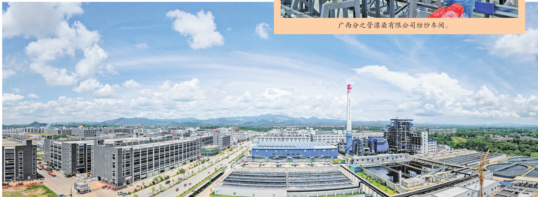
玉林(福绵)节能环保产业园。