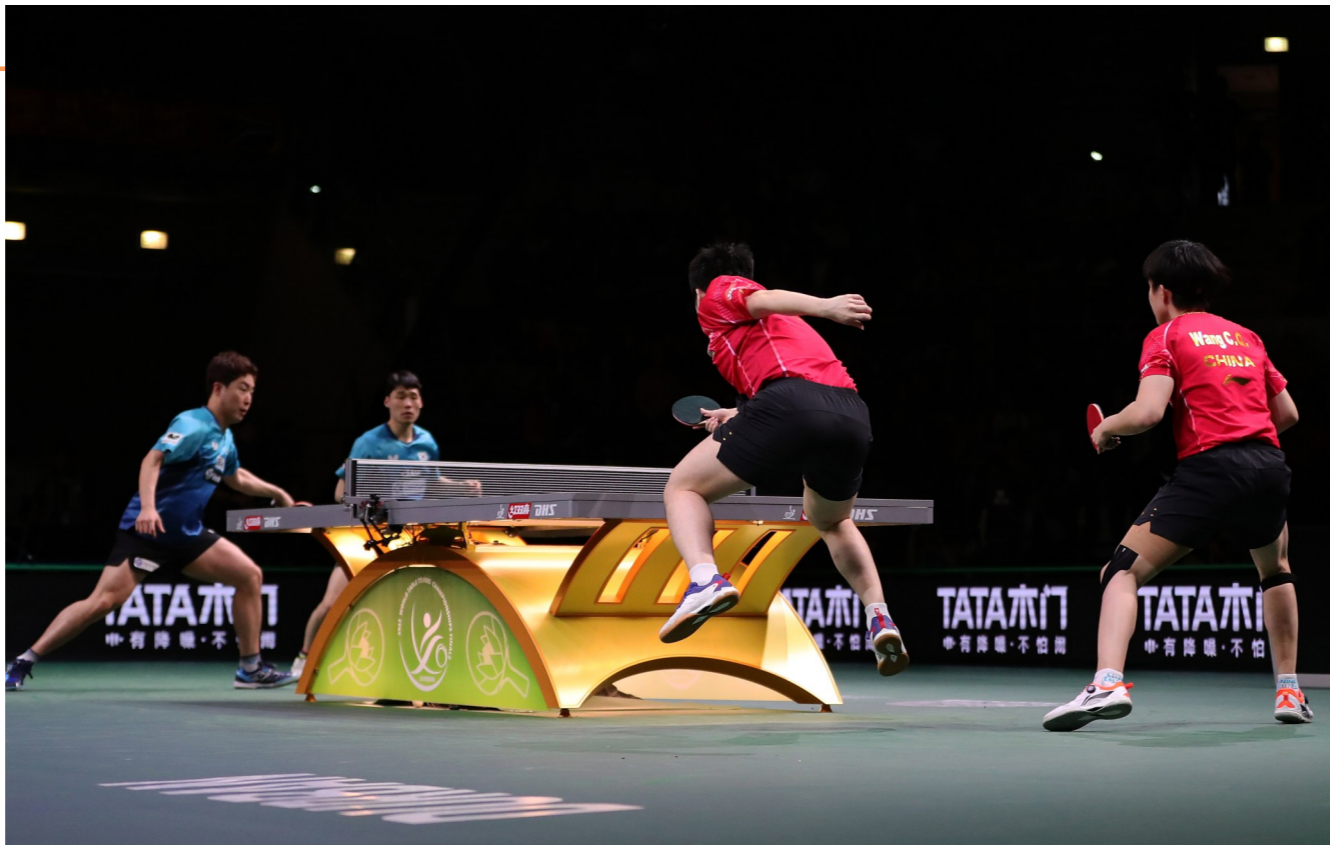
▲5月27日,樊振东(前左)/王楚钦(前右)在比赛中。

“决赛很精彩,第一局在非常困难的局面下逆转了对手,起到了关键作用。”王楚钦赛后说。