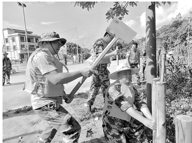
北流市防汛演练场景。

本报兴业讯 为进一步提高到300毫米,石梯河出现超警戒水位,随时有漫坝危险。演练共分为四部分进行,分别是应急队伍集结、石梯河坝加固、群众和学生的疏散、医疗救护。整个演练过程紧张有序,各个环节高效衔接,达到了预期效果。(吴海志)