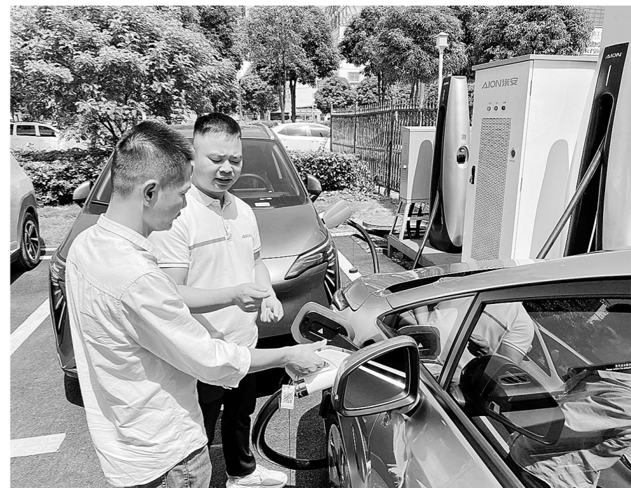
市民详细了解电动汽车正确的充电方法。