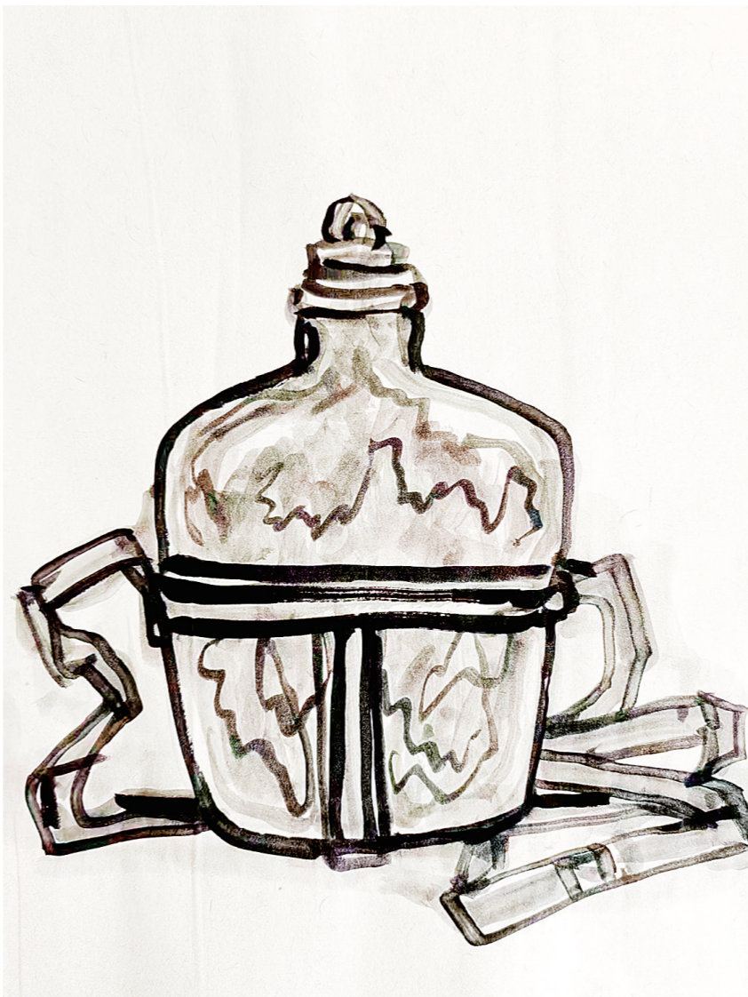
父亲的军用水壶(中国画)