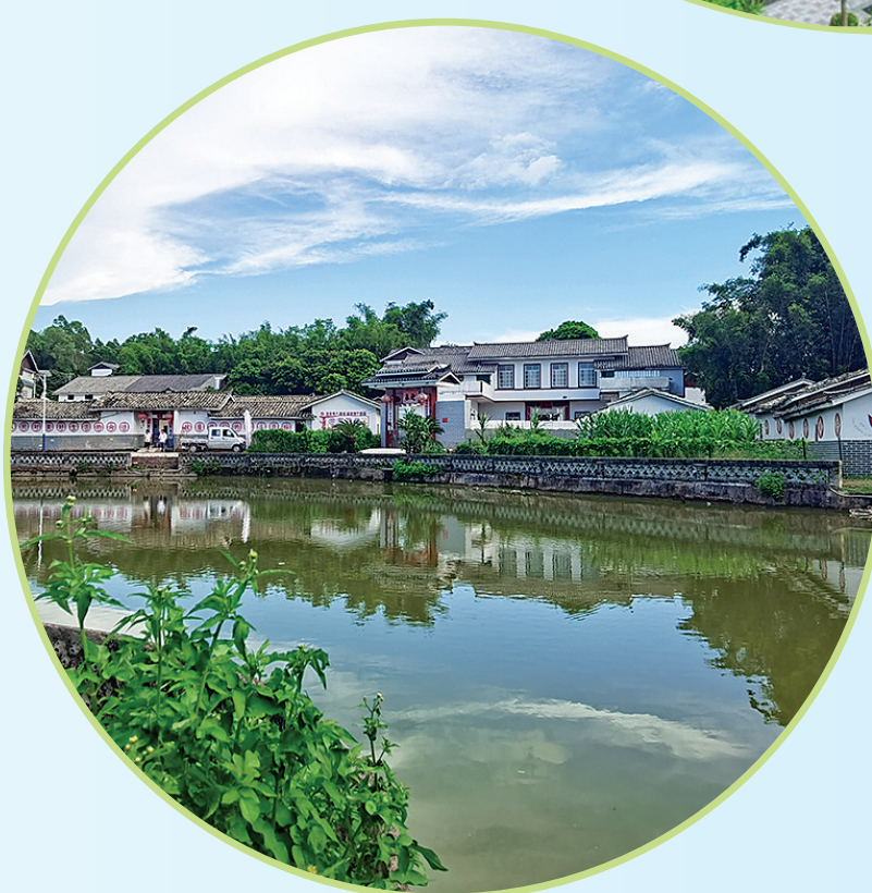
乌石镇龙化村新貌。