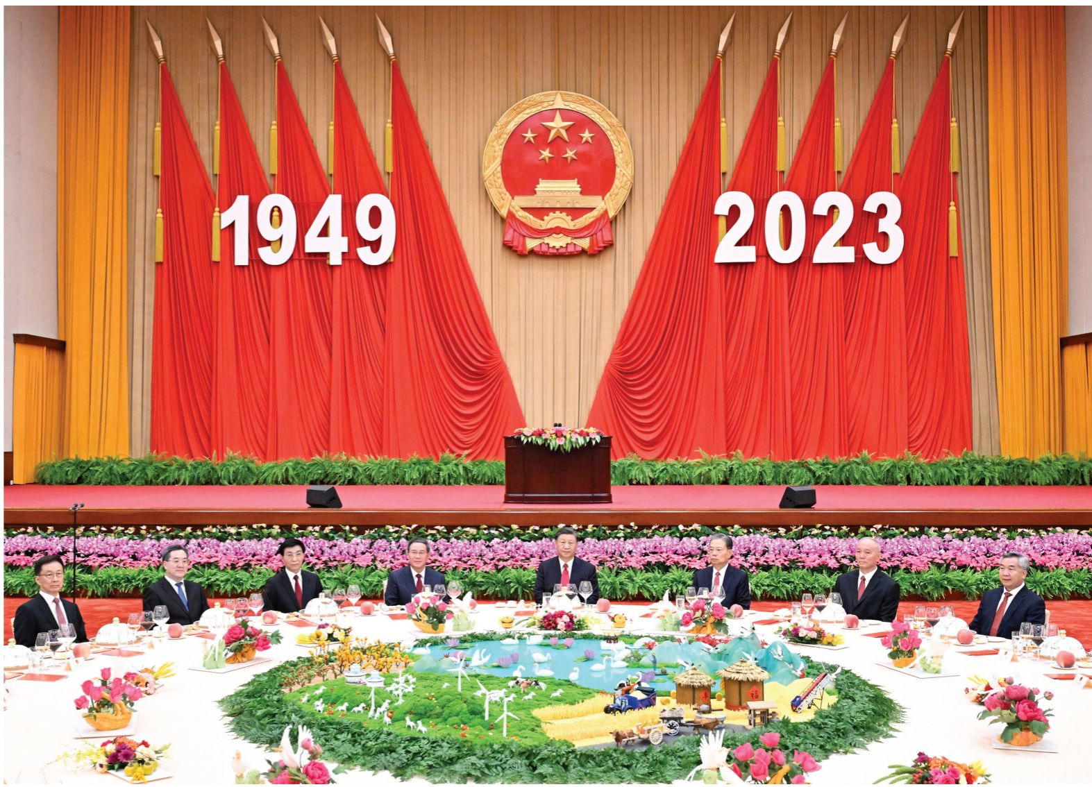
▶习近平、李强、赵乐际、王沪宁、蔡奇、丁薛祥、李希、韩正等党和国家领导人与中外人士欢聚一堂,共庆中华人民共和国华诞。

新华社北京9月28日电 庆祝中华人民共和国成立74周年招待会28日晚在人民大会堂举行。中共中央总书记、国家主席、中央军委主席习近平出席招待会并发表重要讲话。他强调,新征程上,我们的前途一片光明。团结就是力量,信心赛过黄金。我们要坚定信心,振奋精神,团结奋斗,继续爬坡过坎、攻坚克难,坚定不移朝着强国建设、民族复兴的宏伟目标奋勇前进。