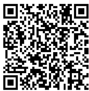
扫码查看详细名单

据了解,30名火炬手主要是玉林各行各业的优秀代表,既有机关干部,也有村干部;既有人大代表,也有政协委员;既有教师,也有学生;既有教练员,也有运动员;既有企业高管,也有一线工匠。(详情见A2、A3版)