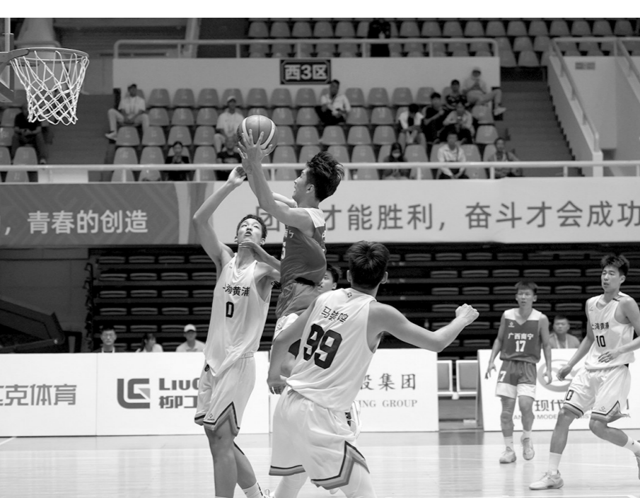
11月8日,首届学青会(公开组)篮球男子U18组小组赛进入第三个比赛日,广西南宁队遭遇上海黄浦区队,南宁队以74:108不敌上海黄浦区队。图为南宁队队员突破上篮。

这场对抗加时赛才分出胜负 岛队91:88领先3分,随后进攻不成,太原队抢到篮板球后快速反击,投进三分,91:91平。双方进入加时赛。 加时赛,太原队手感火热,先进三分,随后青岛队回敬一个三分,94平。随后青岛队篮下连续进攻得分,而太原队则多次进攻不成,最后30秒,太原队连续外线三分投射,但均无功而返。最终,青岛队以102:96笑到最后。 星。而大同队不断冲击杭州队篮筐得手的同时,外线也不断得分,分差在比赛最后3分30秒被拉大到11分。然而,杭州队的外线投篮并没有熄火,分差一度缩小到5分,但很快又被大同队拉开。最终,大同队以91:86战胜杭州队,收获赛事三连胜,杭州队则吞下首败。