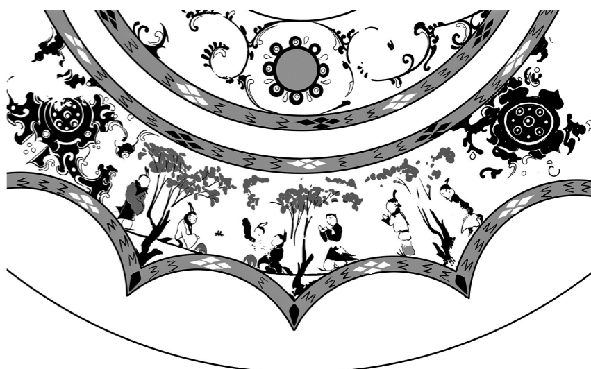
西汉彩绘人物车马镜局部“宴饮”图案线稿图。