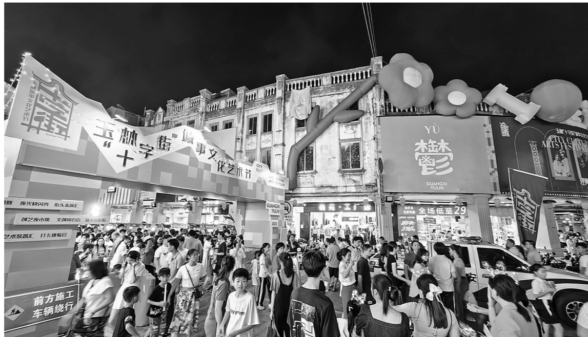
玉林“十字街”城事文化艺术节让玉林城区十字街面貌焕然一新。

一个大型的稻田艺术装置区,成为了市民“扮靓自己”的网红地;一场农趣运动会,吸引了数百人参与其中;一座迷宮,让人小孩玩得亦乐乎……玉林市庆祝中国农民丰收节暨上秋收稻田文化艺术节将文化创意融入传统农业,利用现代文化科技和创意,让农业文化焕发新的魅力和活力,展示了玉林独具的地方特色,浓墨重彩地谱写了一幅幸福玉林的生动画卷。 “让学生们认识以前的农具,让他们了解农耕历史,体味乡土民俗。”在艺术装置区,有牛轭、风柜、堆谷耙和木犁等农具的图片和文