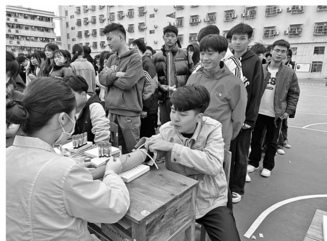
医生为考生进行体检。

本报讯(记者 覃琴)11月27日至12月12日,2024年高考体检工作有序进行。玉林市第一人民医院为玉林城区(含福绵区)各中学以及社会考生等共计27554名考生采用“无纸化”模式进行高考体检,单日最高体检人次达2600人。为确保2024年高考体检工作安全、平稳有序进行,高考