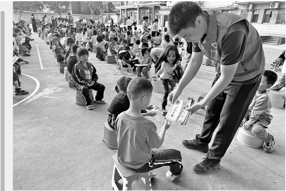
志愿者给同学们分发禁毒资料。

探索成立回归玉商玉工服务中心,为玉工回归就业、企业用工搭建服务平台,做好回归玉商玉工子女户籍、教育、医疗、社保等服务,为回归玉商玉工解决后顾之忧。