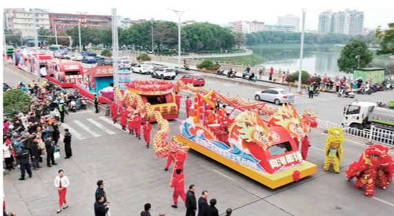
首届玉林市“佼佼街”迎春花事“龙游醉城”花车巡游。

千年文脉,是厚重过往,亦是崭新序章。 2023年以来,玉林市坚持守正创新,实施文化塑城工程,深入挖掘积淀千年的城市文化矿藏,提炼凝聚广布民间的传统文化精髓,打造独具玉林特色的新时代文化品牌,以文化的赓续焕新推动全市思想解放、改革创新,为拼搏铸魂,为前行淬火,为高质量发展注入源头活水。