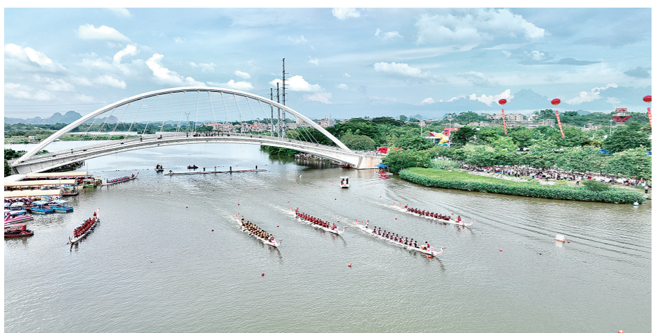
2023年6月20日,“龙腾端午·潮起玉林”2023年玉林市端午文化嘉年华暨年中惠民欢乐购开幕式在玉林市园博园举行。图为“水韵竞渡”龙舟邀请赛比赛场面。