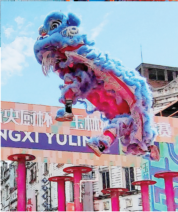
玉林“十字街”城市文化艺术节上的舞狮表演。