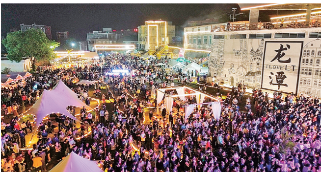
在博白县龙潭镇举行的“面朝大海·春暖花开”龙港乡村音乐嘉年华,让两广三地群众共享文化大餐。