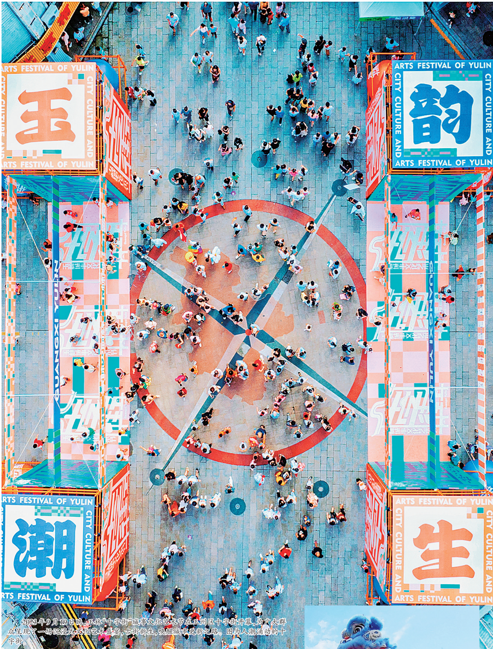
2023年9月19日晚,玉林“十字街”城市文化艺术节在玉州区十字街开幕,为广大群众呈现了一场沉浸式文化艺术盛宴,古街新生,唤醒城市更新之路。因为人潮涌动的十字街。