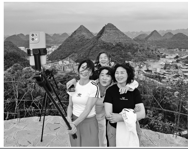
近日,在贵州省安龙县郊外的几座山体因形状酷似金字塔而引发关注。这些山体呈锥形,在结构上呈现出明显的层叠状。

新华社太原5月15日电(记者 柴婷)5月12日,新华社“新华视点”栏目播发《拉五保老人假看病、假住院——山西一医院涉骗保调查》一稿,曝光山西省吕梁市汾阳市残联中医医院诱导一些无病或轻症的农村五保老人住院治疗,存在虚增项目、“挂空床”等行为,涉嫌骗取医保基金。对此,汾阳市高度重视,当地公安机关目前已对10人采取刑事强制措施。