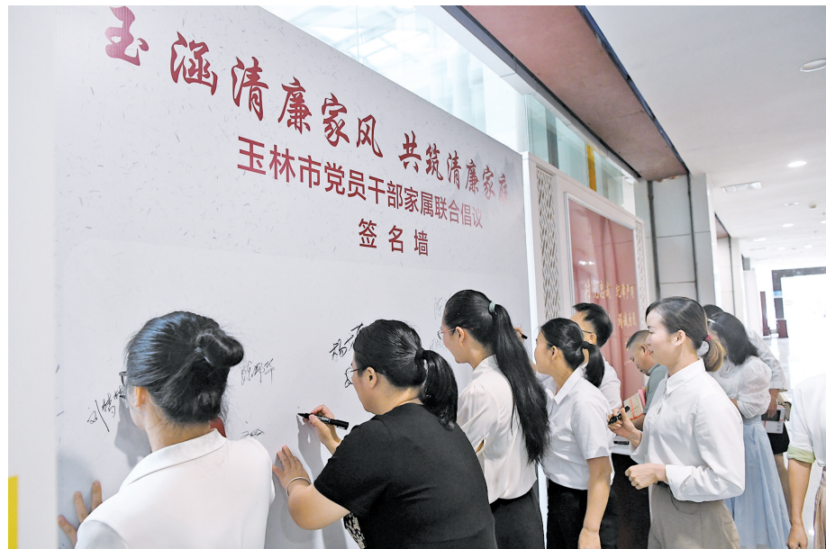
▲玉林党员干部家属联合签名,倡议共筑清廉家庭。

本报(记者 林声远)“让我们携手从自身做起,从家庭做起,做清廉家风的推动者、清廉楷模的实践者、清廉防线的监督者。用千万个清廉小家,构筑清廉玉林的坚固防线。”5月15日,玉林市党员干部家属联合签名,倡议弘扬清廉家风,共筑清廉家庭。