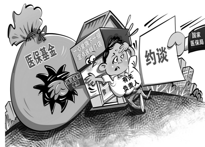
约谈 (新华社发 南海春作)

据新华社北京6月2日电(记者 徐鹏航 彭韵佳)据国家医保局2日消息,一心堂旗下一些定点连锁门店存在较为典型的违法违规使用医保基金行为,国家医保局基金监管司对一心堂药业集团股份有限公司有关负责人进行了约谈。