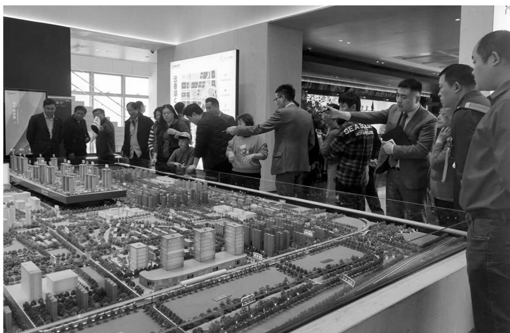
2024年5月28日在上海嘉定区拍摄的“沪九条”房地产新政实施后首个开盘项目的现场(手机照片)。

“我国每年有1000多万名高校毕业生,还有大量农业转移人口进城。”中国宏观经济研究院研究