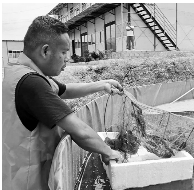
▲养殖户在查看蓝龙虾生长情况。