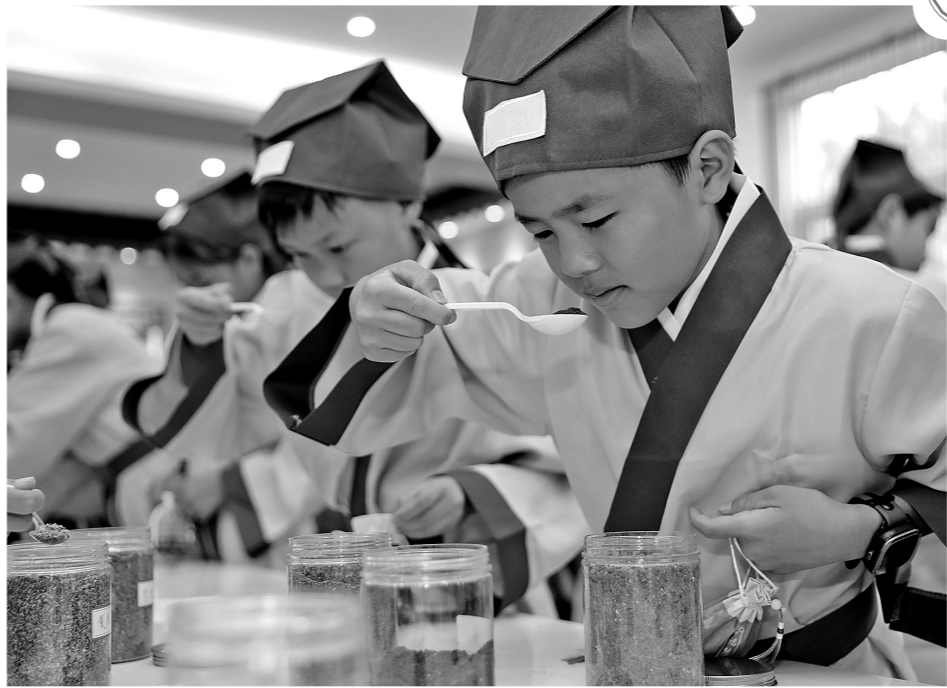
“这些中药材好香啊!”“我喜欢薄荷味,清香醒神,我要装多一些。”6月7日,在玉东新区第三小学的中医药文化体验馆内,桌面上摆放着的中药材散发着馥郁的香气,穿着汉服的学生集聚在一起,正亲手制作具有中国传统端午节特色的香囊(如图)。活动涵盖参观百草园、闻香识中药、香囊DIY等环节,让学生在民俗体验活动中感受传统文化。