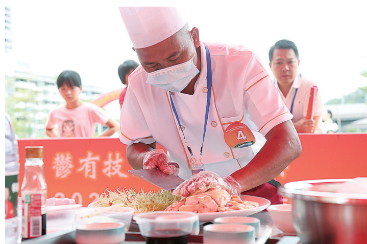
参赛选手正在认真摆盘。

本报讯(记者 阙繁 实习生 韩耀飞)7月29日,玉林市2024年“粤有技能 产业振兴”职工职业技能大赛白切美食烹饪技能竞赛在博白县举行,厨艺高手同台竞技,共同探索白切美食的奥秘。