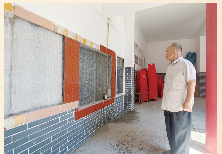
在容县十里镇甘旺村韩氏对阳宗祠内,刻写着韩氏家规家训以及祖辈事迹。

韩姓是一个多民族、多源流姓氏。韩姓文化作为中华姓氏文化的重要组成部分,承载着丰富的历史底蕴和深厚的文化内涵。 韩氏宗族的源起与变迁,是中国姓氏文化的一个缩影,它记录了中华民族历史发展的步伐,同时也凝聚了韩氏族人坚韧不屈、砥砺前行、自强不息的精神品质。从古老的封地,到今天的广阔天地,韩氏族人始终大力弘扬韩氏文化,传承韩氏故事,书写“韩氏故事”,创造“韩氏传奇”。走进韩氏的世界,能感受其传承千年的宗族精神和文化魅力。