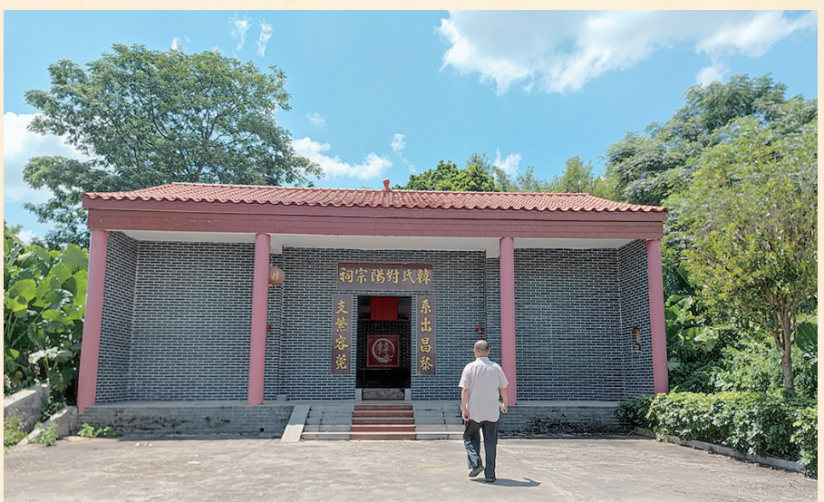
容县十里镇甘旺村韩氏对阳宗祠已有数百年历史(现存宗祠为2018年重建)。

政权北魏孝文帝从平城(今山西大同)迁都洛阳,实行汉化改革,把鲜卑姓氏改为汉姓,其中的出大汗氏改为韩。 源流五: 源于倭夷,出自唐朝时期延卫韩志和,隶属于王昭明为氏。大唐王朝在唐宪宗李纯执政时期(公元805—820年在位),属下一个著名的飞龙卫士韩志和,为倭倭国人。他崇尚中华文化,自愿留居中原,成为唐宪宗的贴身卫士。韩志和有着灵巧的手艺,他善于把木头雕刻成鸢鸟鹤等形状,栩栩如生。传说,他曾在唐宪宗面前放出五六十头蝙蝠虎子(一种大体型的蜘蛛),把它们开始站成队,让它们按照曲调跳舞,随着曲子的节拍起舞。唐宪宗看到后非常高兴,重赏给他许多金钱和丝绢,并赐姓为“韩”,名“志和”。韩志和后来留居中国,后裔子孙融入汉族,主要分布在四川、贵州一带地区,世代为韩氏。 源流六: 源于各少数民族,属于汉化改姓为氏。在今55个少数民族中,均有韩氏族人分布,其来源大多是在唐、宋、元、明、清时期中央政府推行的羁縻政策和改土归流运动中,流改为汉姓韩氏,世代相传至今。