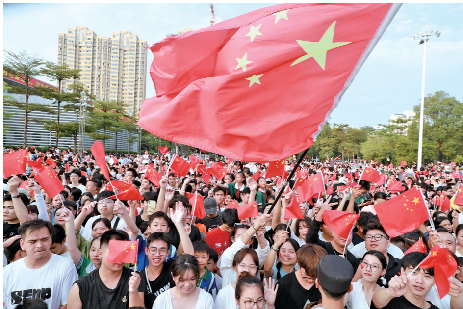
人们挥舞手中的国旗,祝福祖国繁荣昌盛。