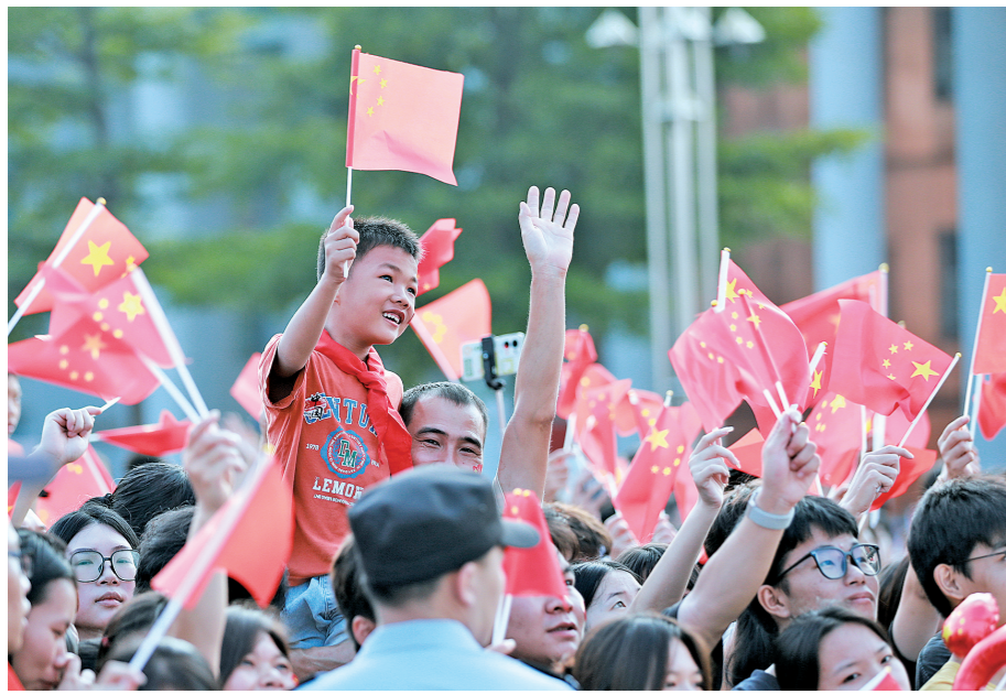
晨光初晓,小朋友翘首以盼庄严时刻的到来。