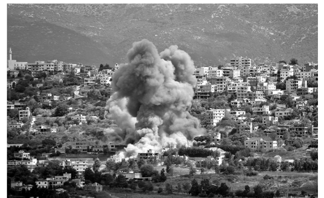
这是10月1日拍摄的以军空袭黎巴嫩亚姆后产生的浓烟。黎巴嫩政府军消息人士1日告诉新华社记者,以色列当天对黎南部数十处城镇实施空袭和炮击,已造成6人丧生、4人受伤。

德国、英国、加拿大等国家已开始将本国人员陆续撤离黎巴嫩。法国派出一艘军舰前往黎巴嫩海域进行“预防性”部署,以备可能的撤离。