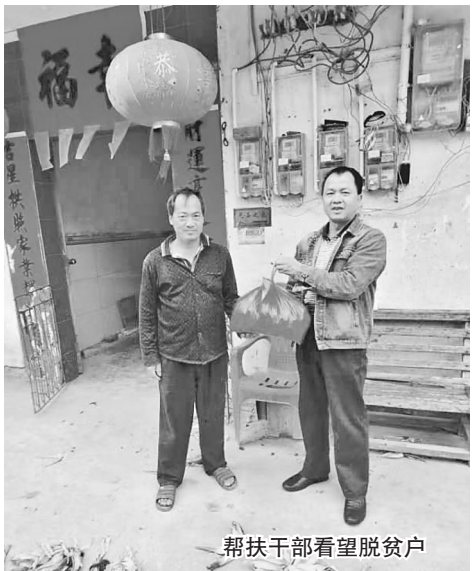
帮扶干部看望脱贫户

水垌村于2015年冬经精准识别后被纳入自治区级贫困村,当时全村共有贫困户63户291人,村集体经济几乎为零,村道大部分是沙石路。市直机关派出人员对贫困户进行帮扶,两个市直单位作为水垌村脱贫攻坚的后盾单位,与此同时,镇、村干部和学校教师也主动帮扶贫困户。通过大家的共同努力,仅用3年时间,63户贫困户291人就有48户119人脱了贫,村集体经济收入达8万多元。通过自治区扶贫考评组考评,水垌村于2018年实现了整村脱贫。