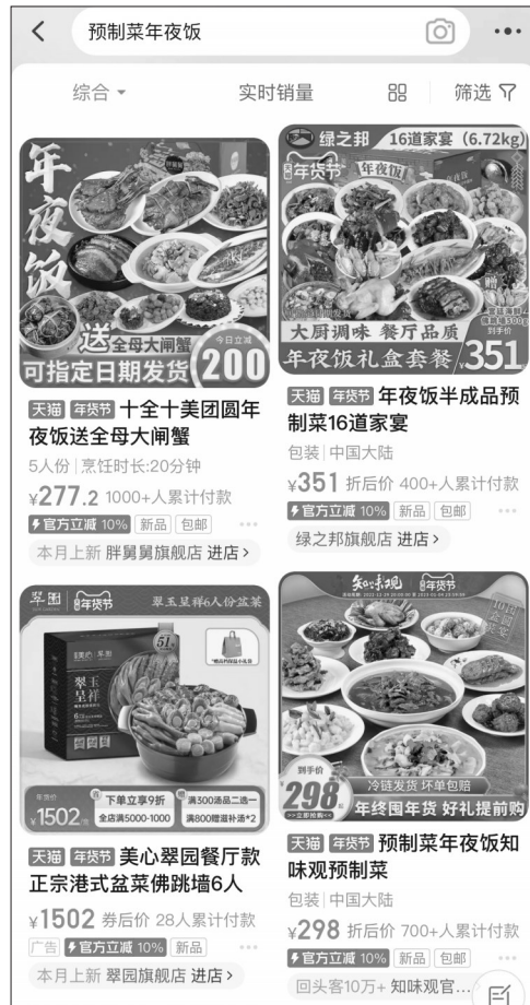
▲购物平台“预制菜年夜饭”颇受青睐。

据了解,“预制菜”的推出,无疑在当前的形势下,为不少渴望团聚的家庭,增添了新的过年“味道”。但“食材是否新鲜”等则是不少消费者对预制菜的最大顾虑,记者在某宝购物平台看到,为打消消费者对于预制年夜饭新鲜度的顾虑,不少商家纷纷打出“不添加防腐剂”“冷链发货”“坏单包赔”等宣传字样。