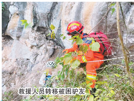
救援人员转移被困驴友。

10月25日,一名72岁的驴友骑自行车从玉林城区出发到达兴业县葵阳镇神象山,独自攀登至悬崖平台后无法自行下山。当日15时23分许,兴业县消防救援大队接到报警后,立即赶赴现场营救。救援人员克服路远、山势险峻等重重困难,于16时35分将这名驴友转移到安全区域。