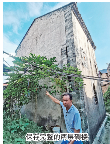
保存完整的两层碉楼

看到寨内古井井口是由横条石堆砌而成,井水依然清澈;在曾屋寨的北侧和西侧,还可以看到部分寨墙保存完好,由于长年累月风吹雨淋,原先高高的寨墙有所减低,有的寨墙上还长满了藤蔓和灌木。即便如此,高约5米的外墙依然气势不凡。