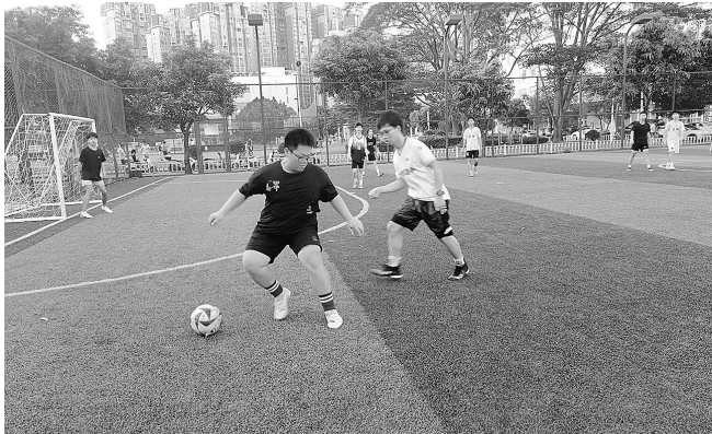
▲市民在足球场上挥洒激情。