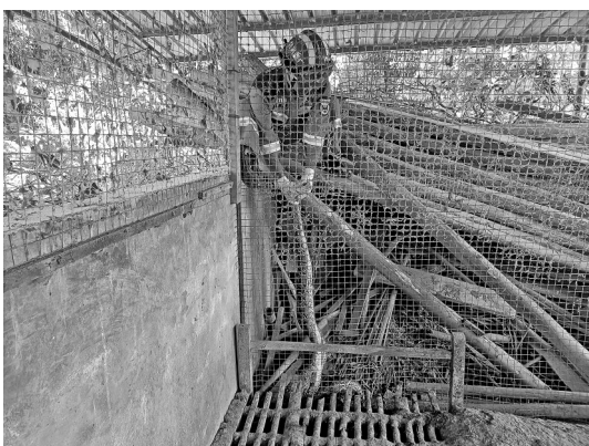
▲消防员成功捕获蟒蛇。

本报讯(通讯员 李馨 韦功兵)炎炎夏日,正是蛇类出没的时节。8月7日上午,博白县英桥镇村民在自家鸡舍中发现一条蟒蛇,当时蟒蛇已吞食一只鸡,正盘踞在鸡舍角落“消食”,村民赶紧报警求助。