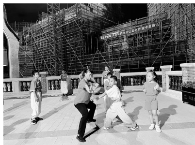
▲拳师在传授“州珮功夫”。

“州珮功夫”源于玉城街道州珮村(现州珮社区),流传至今已有200多年。闲暇之余,习武练功是州珮人的日常,不少孩子在儿时就被送到武馆练武,一些州珮媳妇、姑娘也爱习武。2014年,“州珮功夫”入选第五批自治区级非物质文化遗产项目名录。